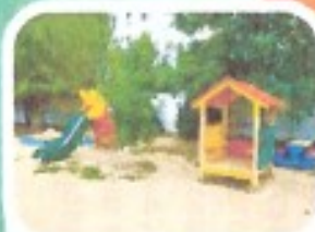
Прогулки на свежем воздухе