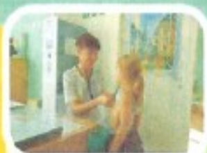
Наблюдение и лечение